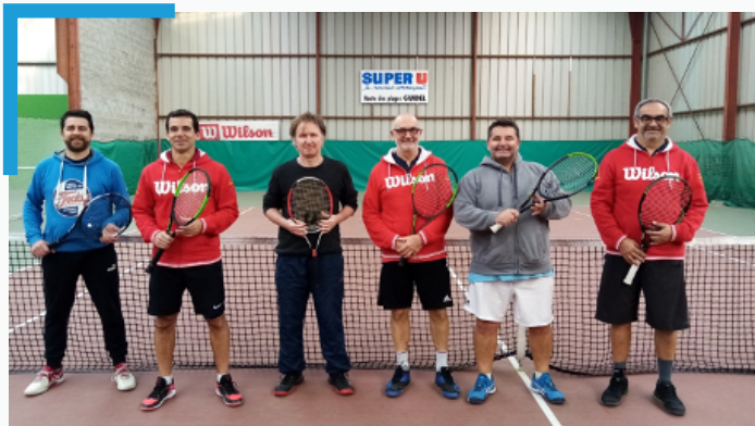
Un début de saison qui avait pourtant bien commencé finale du championnat +45 à Guidel

Le Forum des ASSOS. devait lancer la saison 2020/2021 sur de bons rails, c'était plutôt bien parti, un équilibre des inscriptions, des cours qui reprenaient avec plusieurs groupes complets.